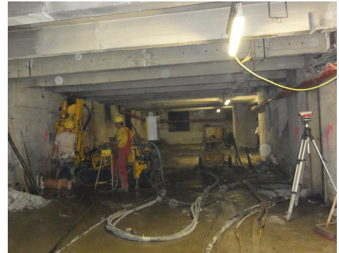
地下室内での施工状況