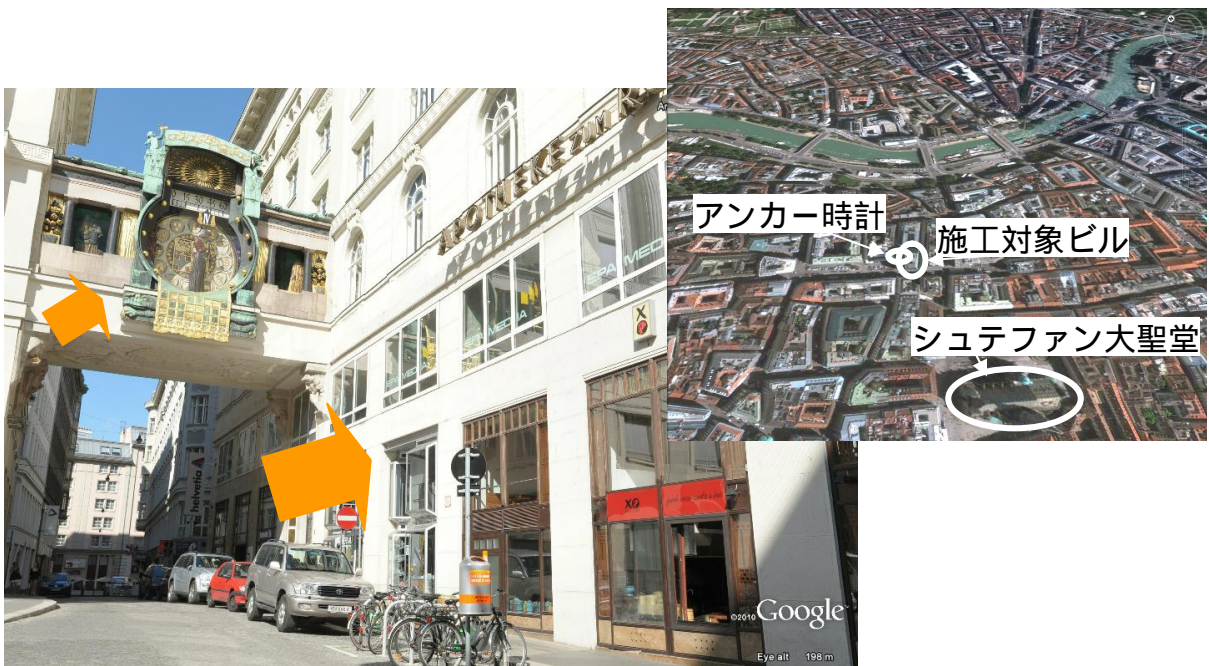
アンカー時計と施工対象ビル